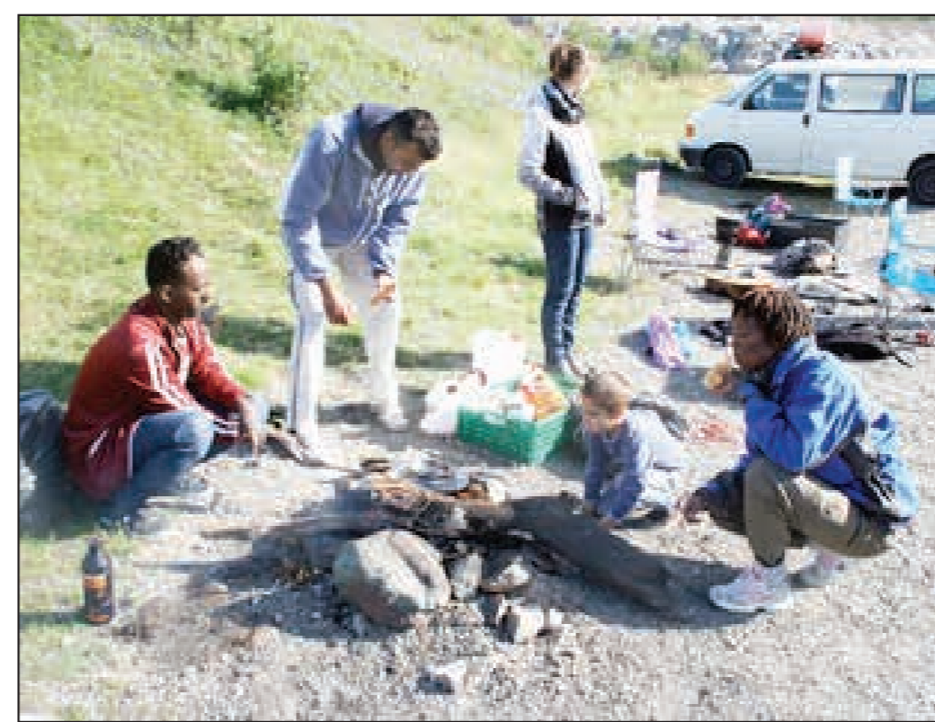
BÅL: Her kokes det bålcaffe og mat etter norske turtradisjoner.