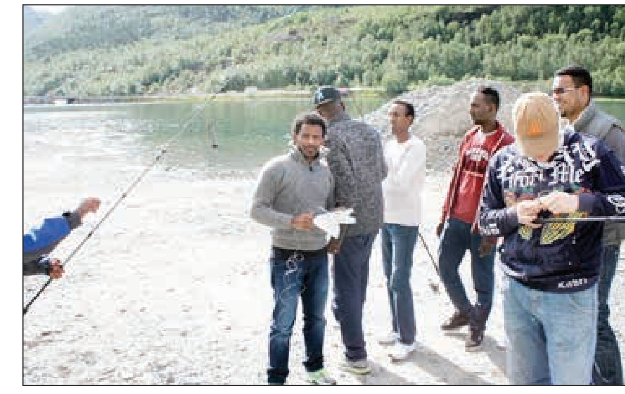
1191: VASE: Det er ikke greit å unngå vase på fiskesnøret på sin aller første fisketur.