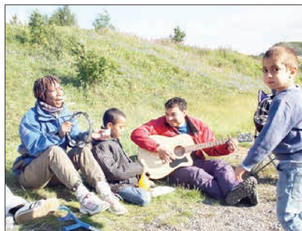
FIN SOMMERDAG: Avslapning på stranden.